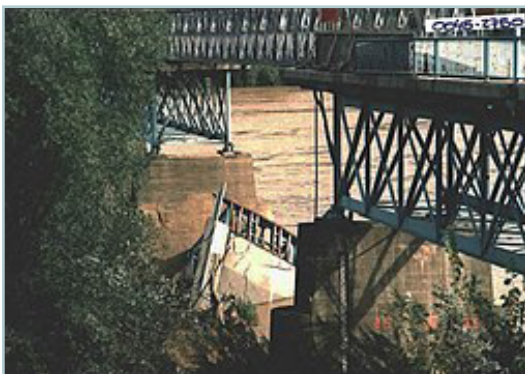
הרס הגשר בברקו שבבוסניה והרצגובינה, כחלק מההרס הנרחב של רכוש.

הפסיקה של ה-ICTY מבהירה גם היא את המשמעות של "הריסה מופקרת". החלטת בית הדין בעניין פרליץ (Prlić) מתארת את הפשעים שביצעו מנהיגי המיליציה הקרואטית (HVO) במוסלמים בוסנים. במחוז המוניציפלי של פרזור (Prozor) למשל, חיילי HVO הציתו שבעים וחמישה בתים של מוסלמים, בעוד בתים קרואטים לא נפגעו. 19 בעיירה פרצני (Parcani) חיילי HVO הציתו בתים כדי לנקום בבני העיירה שהתחבאו ביער. 20 לשכת השופטים גם הצביעה על הרס נרחב של אזורים מוסלמיים בעיירות, לצד ביזה נרחבת של רכוש בבעלות מוסלמית.