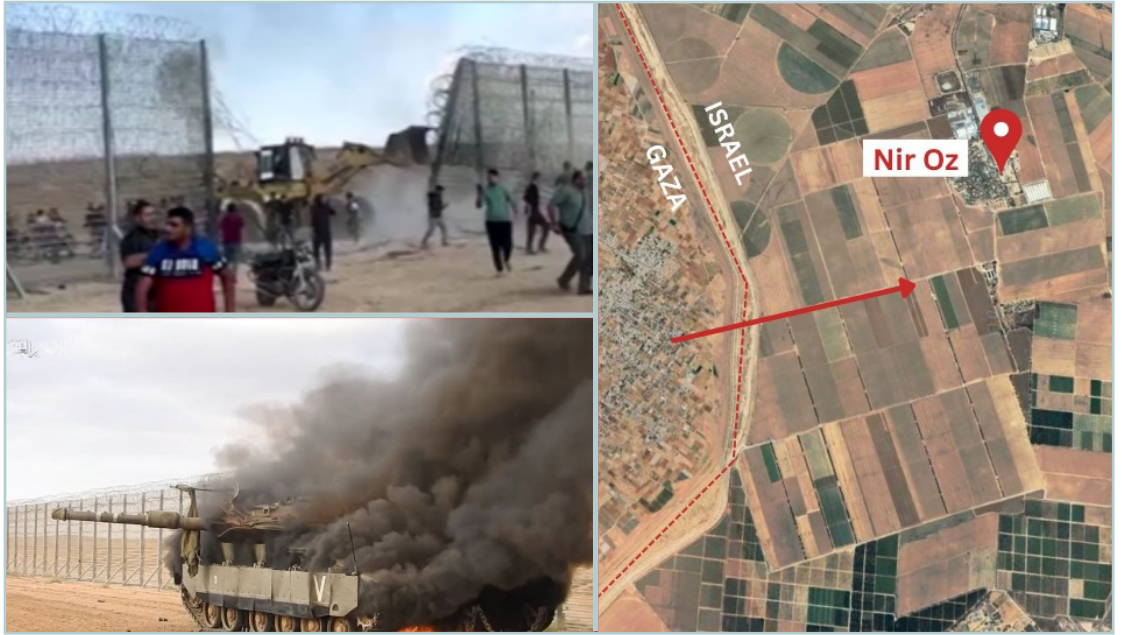
פעילי טרור פורצים את הגדר ליד ניר עוז בשבעה באוקטובר.