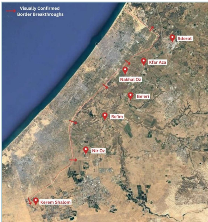
מפת חציית הגבול מעזה ב-7 באוקטובר. Google Earth / Canva