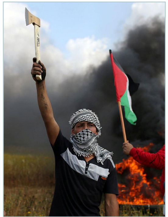
פעיל טרור פלסטיני ליד גבול עזה בזמן "צעדות השיבה הגדולה".