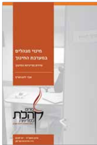
סיוון תשע"ח - יוני 2018 נייר מדיניות מס' 38