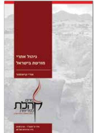
אדר א' תשע"ו - מרץ 2016 נייר מדיניות מס' 26