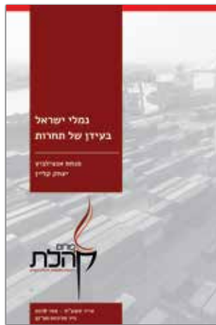
אייר תשע"ח - מאי 2018 נייר מדיניות מס' 37