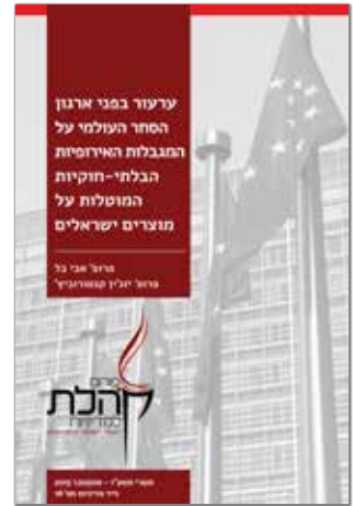
תשרי תשע"ו - אוקטובר 2015 נייר מדיניות מס' 18