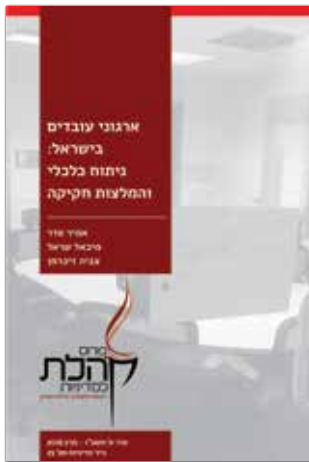
אדר א' תשע"ו - מרץ 2016 נייר מדיניות מס' 25