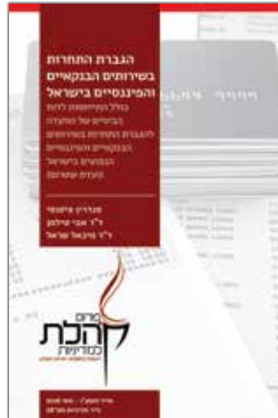
אייר תשע"ו - מאי 2016 נייר מדיניות מס' 28