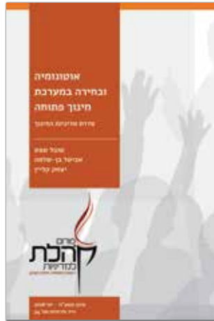
סיוון תשע"ח - יוני 2018 נייר מדיניות מס' 34