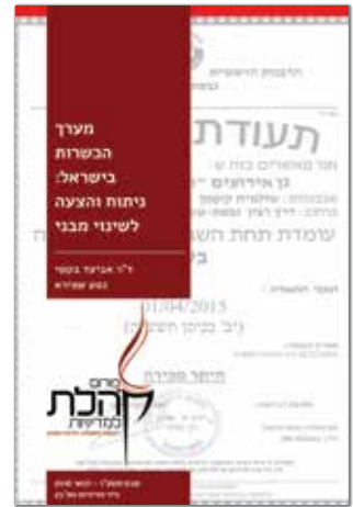
שבט תשע"ו - ינואר 2016 נייר מדיניות מס' 23