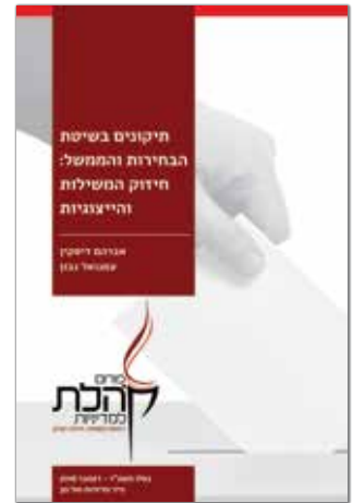
כסלו תשע"ז - דצמבר 2016 נייר מדיניות מס' 30