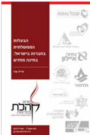
ניסן תשע"ז - אפריל 2017 נייר מדיניות מס' 32