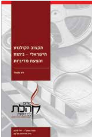
תמוז תשע"ו - יולי 2016 נייר מדיניות מס' 29