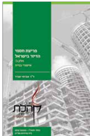
כסלו תשע"ו - נובמבר 2015 נייר מדיניות מס' 21