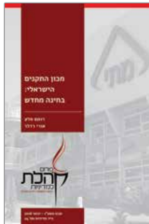
שבט תשע"ו - ינואר 2016 נייר מדיניות מס' 24