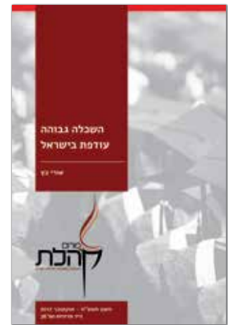
חשוון תשע"ח - אוקטובר 2017 נייר מדיניות מס' 36