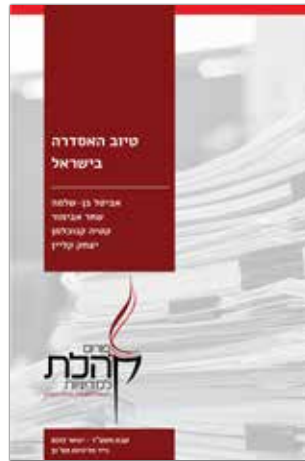
טבת תשע"ז - ינואר 2017 נייר מדיניות מס' 31