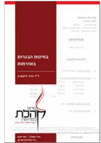
אייר תשע"ז - מאי 2017 נייר מדיניות מס' 33