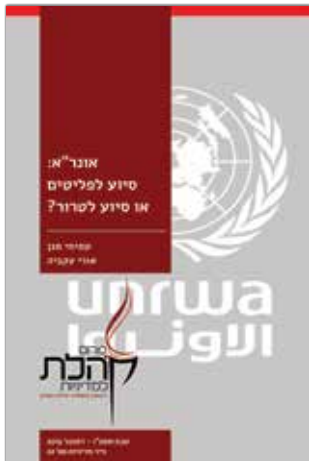
טבת תשע"ו - דצמבר 2015 נייר מדיניות מס' 22