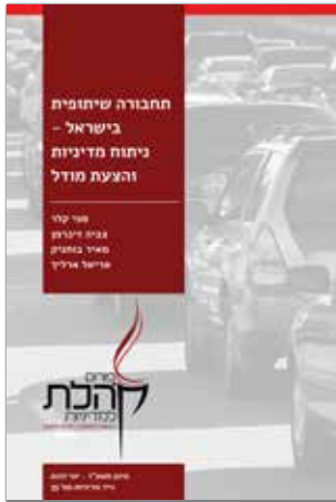
סיוון תשע"ז - יוני 2017 נייר מדיניות מס' 35