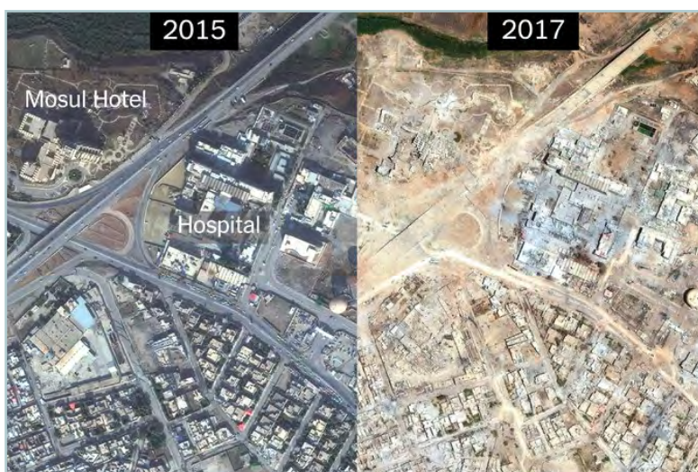
[תמונות לוויין ממוסול – לפני ואחרי הקרבות] 14

ממקרי מבחן אלה ניתן לראות את המובן מאליו – מלחמה היא לא אירוע סטרילי, וכרוכה תמיד בהרס, בחורבן ובמוות. יש לראות את דיני המלחמה לא כניסיון למנוע מלחמות אלא כניסיון למנוע את הסבל העודף שאינו מחויב המציאות מבלי לפגוע בצורך הצבאי.