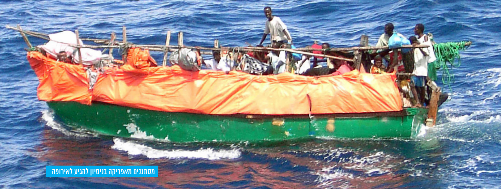
מסתננים מאפריקה בניסיון להגיע לאירופה