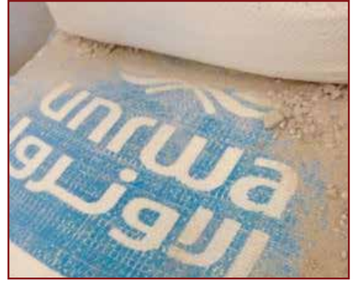
ציוד לחפירת מנהרות עם סמל אונר"א

שוב ושוב כתומכים בטרור או כמעורבים בו, וכאשר מתקני אונר"א משמשים אתרים לשיגור טילים על ערים ישראליות, לא רק שהתדמית הניטרלית של הסוכנות ושל האו"ם נפגעת, דבר שיכול להפריע כאמור לאחרון למלא את תפקידו גם בשאר העולם, אלא שהאוכלוסייה האזרחית ברצועת עזה, אשר מצפה לקבל סיוע והגנה מהסוכנות ומתייחסת למתקניה כאל מקלטים מוגנים, נמצאת בסכנה גדולה של היפגעות בחילופי האש בין ישראל לחמאס, כאשר זה פועל גם מתוך שכונות מגורים וגם מתוך מתקני או"ם ומחנות פליטים.